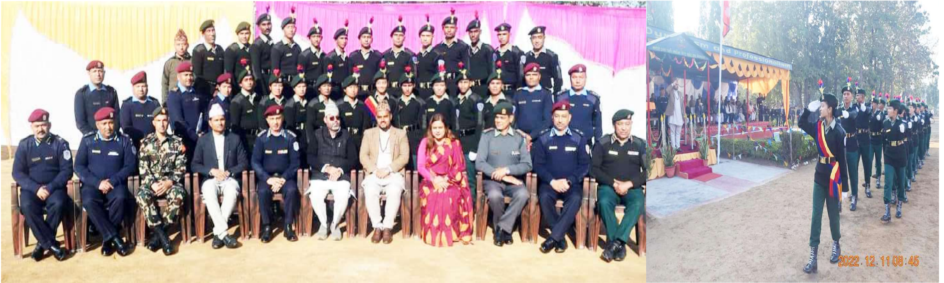
नेपाल प्रहरीको आवासीय तालिम दिएर भर्ना गरिएका कोहलपुर नगरपालिकाका नगर प्रहरीको दीक्षान्त समारोह। वार्यो तस्बिरमा सलामी अर्पण गर्दै नगर प्रहरी।