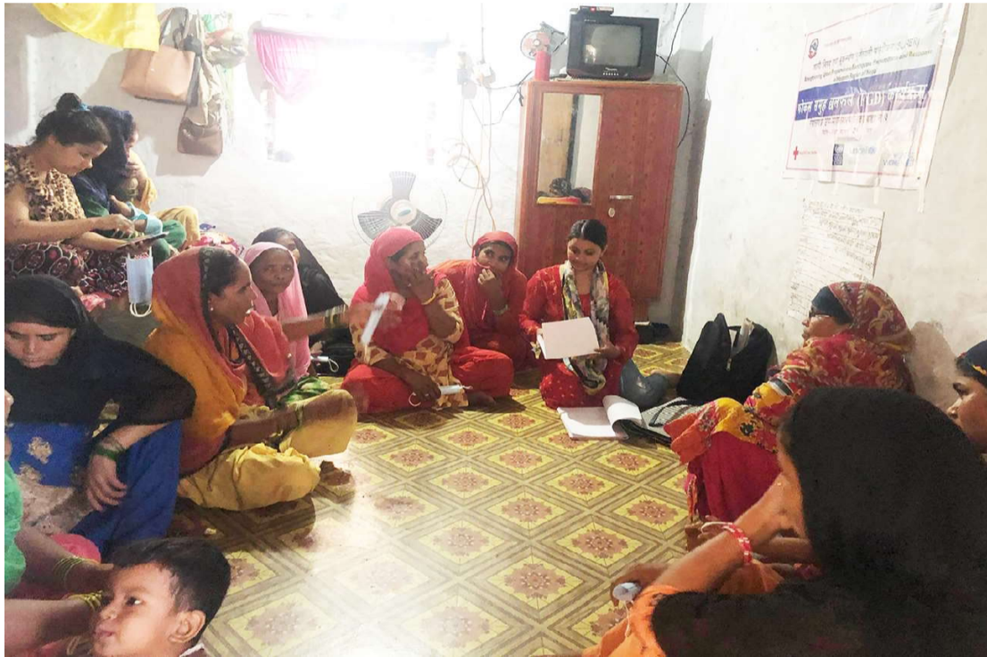
नेपालगन्जको एकलैनी क्षेत्रका घरमा भूकम्पीय जोखिमबारे अध्ययन गर्न छलफल गरिँदै ।

वडा नंबर ३ को एकलैनी, सदर लाइन रोड, लक्ष्मी चलचित्र हल क्षेत्र, जामा मस्जिद, अनाथालय माध्यमिक विद्यालय र दशरथचन्द्र रोडका साथै वडा नंबर ७ को गगनगन्ज, डीएसपी रोड, रानी तलाउ, महेन्द्र माध्यमिक विद्यालय क्षेत्र, एमपी रोड लगायतका बस्तीका घरमा भूकम्पीय जोखिमको