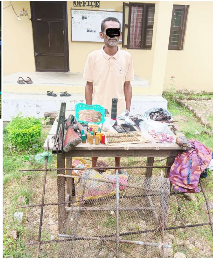
अनुगमनका लागि राखिएका स्वचालित क्यामेराको सहयोगमा बिभिन्न अवैध सामग्री सहित पक्राउ परेका व्यक्ति ।