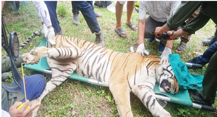
निकुञ्जका सुरक्षार्थीद्वारा डार्ट गरी नियन्त्रणमा लिइएको पाटे बाघ ।