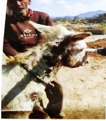
घाँटीको छालामा देखिएका घाउहरू