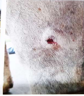
छालामा र चिउँडोमुनि देखिएका गिर्खाहरू