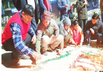
२७औं जनयुद्ध दिवसका अवसरमा साँझ सहिद सेतुविक चोक नेपालगन्जमा दिप प्रज्वलन गरिँदै।